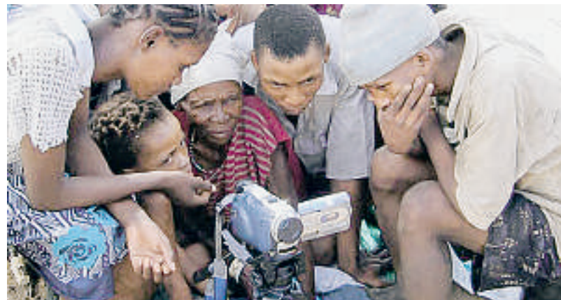
Sprachforschung in Namibia mit Sprechern des bedrohten Akhoe Hail/om.

Das Wichita ist kein Einzelfall. Sprachwissenschaftler schätzen, dass weltweit zwei Sprachen pro Woche untergehen, jedes Jahr dürfte es bis zu hundert Sprachen treffen. Ein Ende des Niedergangs ist nicht abzusehen. Im Gegenteil: Je enger die Welt zusammenrückt, je stärker Globalisierung, Migration und moderne Kommunikationstechniken die Gesellschaften verändern, desto schneller verläuft das Sprachensterben. Heute zählt die Wissenschaft noch mehr als 6000 Sprachen, gegen Ende des Jahrhunderts sind wohl bis zu 80 Prozent von ihnen tot, weil der letzte Sprecher gestorben ist. Be-