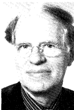
Prof dr Willem Levelt is directeur van het Max Planck Instituut voor Psycholinguïstiek in Nijmegen

Maar die winst wordt duur betaald. De meeste voorwerpen, zoals ballen en bomen, hebben helemaal geen linker- of rechterkant. Dan kun je